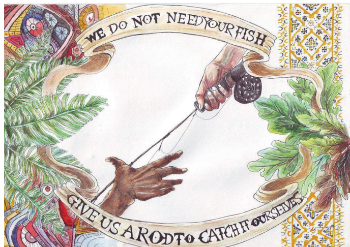
11.m klassi õpilase Desiree Laanepere töö, mis klassi Strasbourgi viis.