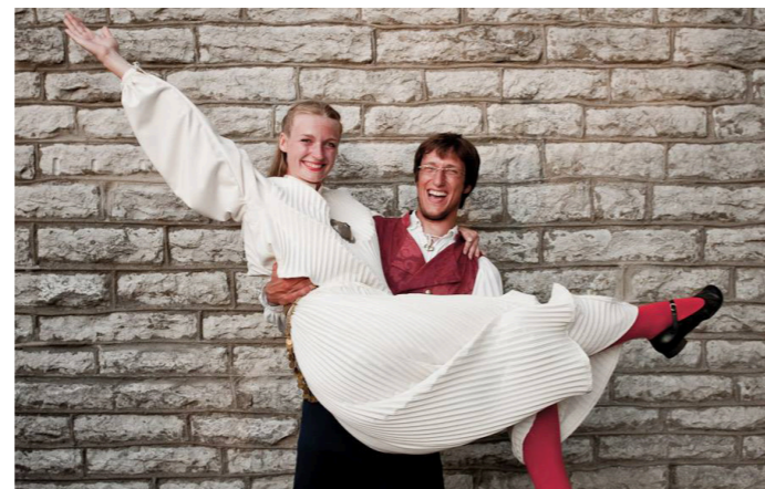
Alati positiivne. Autor: Mait Jüriado

“Tokyo Sushi baar. Seal armusin ma esimest korda elus sushidesse ja seal on rammus lõhesupp. Ma pole elus sees paremat suppi saanud.”