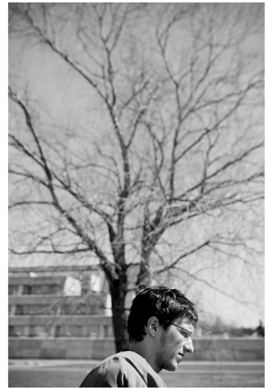
Mõtlik õpetaja ja puu.

“Õppige kontrolltööks (naerab). Jäta meelde, et sa pole kunagi ainulaadne, kõik asjad on kellegi teise poolt öeldud või varem tehtud, aga see, kuidas sa koged või teed neid asju, see on ainulaadne. Iga inimesel on see erinev.”